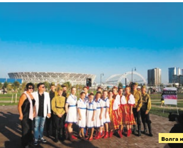
Волга и Волгарек